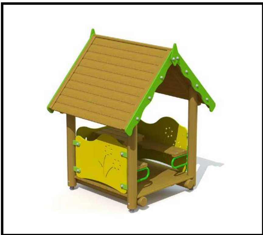
Casa de enanitos. 2.945,70 euros.

JUEGOS INFANTILES PARA COLEGIOS, PARQUES Y ESCUELAS archivos - Martín Mena (martinmena.es)