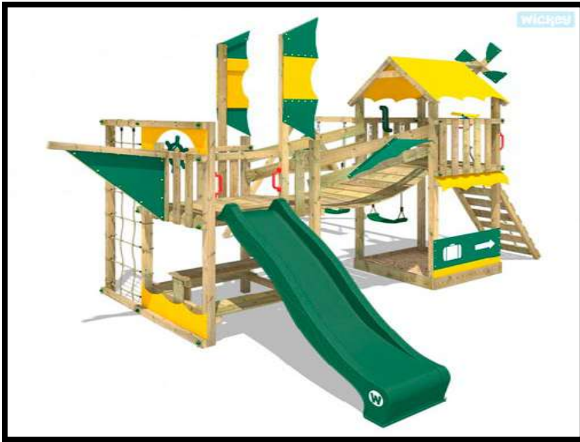
Casa del barco. 1.770,00 euros.

Quien tiene un patio, tiene un tesoro: Jardines, columpios y parques infantiles para disfrutar. - Refugio de Crianza