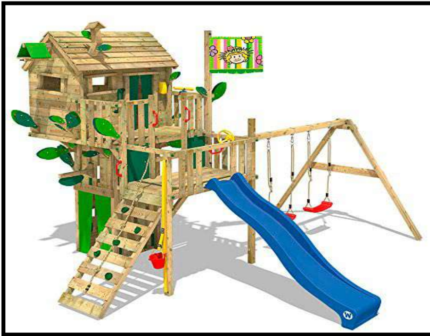
Casita del árbol. 889,00 euros.

Quien tiene un patio, tiene un tesoro: Jardines, columpios y parques infantiles para disfrutar. - Refugio de Crianza