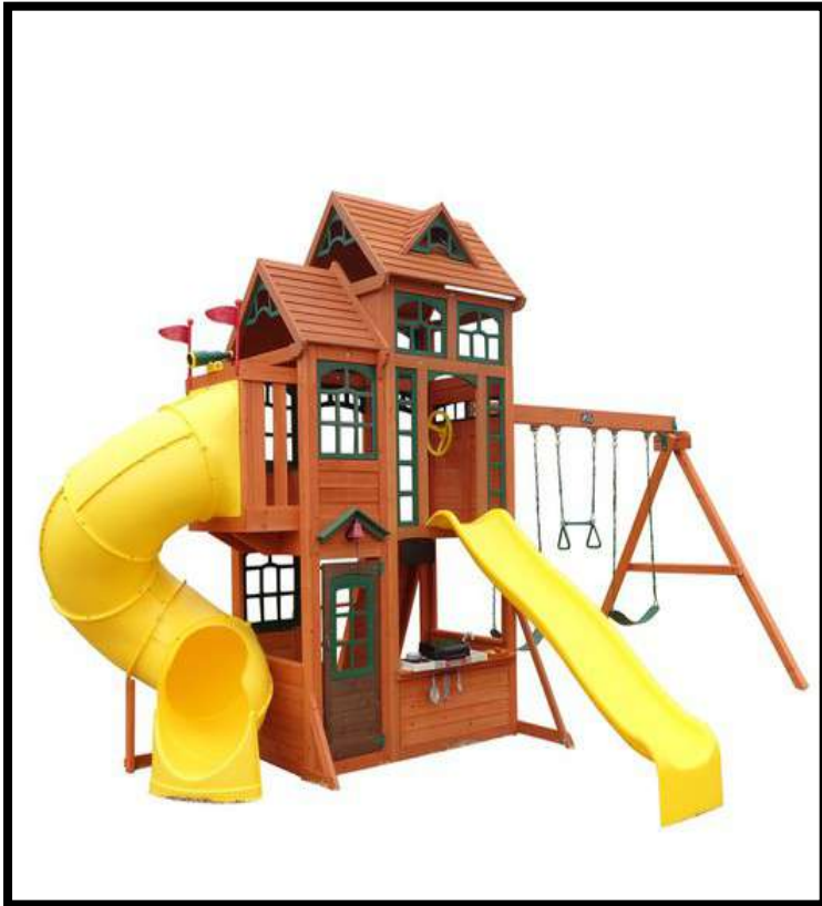
Casa de Madera kids. 2.379,00 euros.

Centro de juegos de madera Canyon Ridge — Brycus